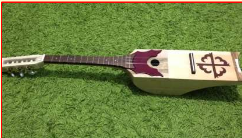
Дечиг - пондар

Музыка имеет огромное значение для этого народа. С ее помощью выражают ненависть, смотрят в будущее и вспоминают прошлое. Многие из национальных музыкальных инструментов распространены и сегодня