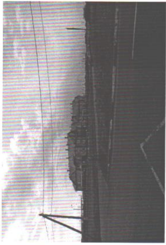
Подход к ДСО со стороны ул. Цветочной