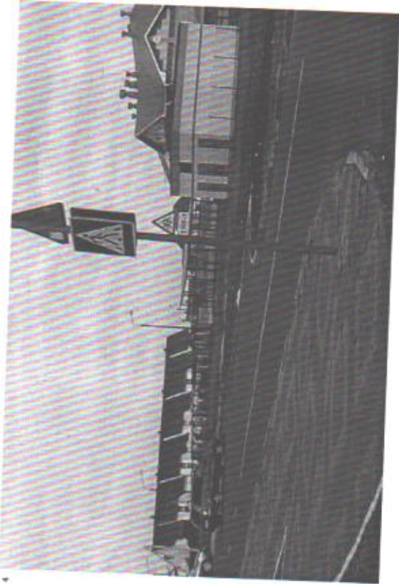
Подход в ДСУ со стороны ул. М.Н.Мордасовой