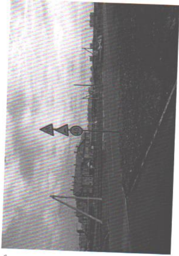
Подход в ДСУ со стороны ул. М.Н.Мордасовой